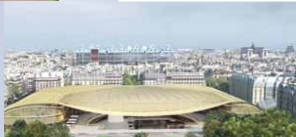
Cité des Cultures Urbaines - Paris (Chatelet les Halles)