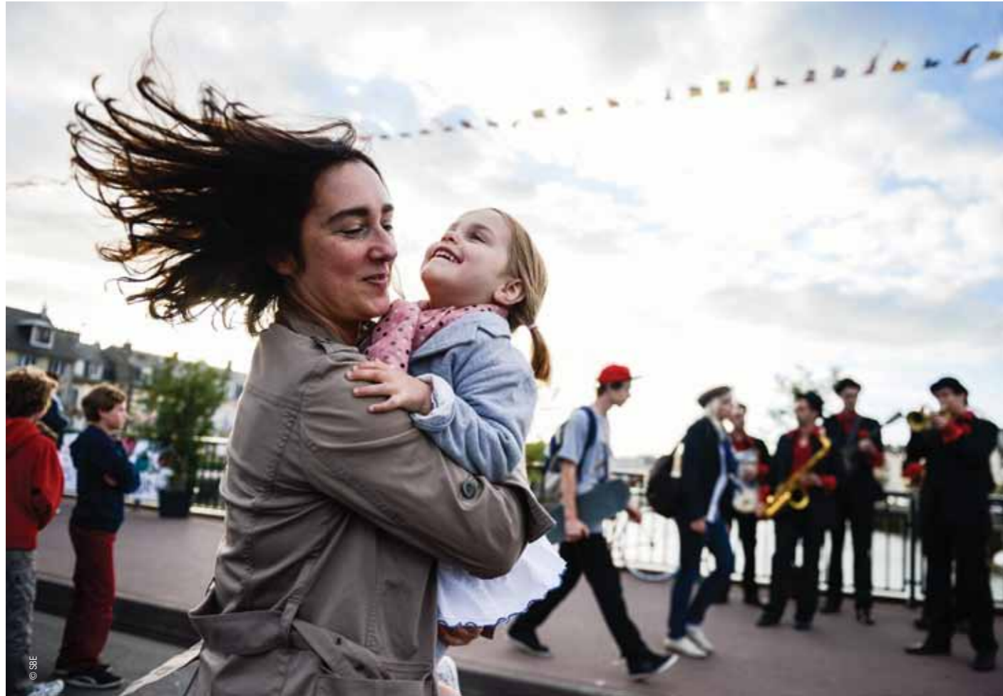
9 juin 2012 : Deauville et Trouville se retrouvent une nouvelle fois pour une fête des voisins chaleureuse et festive.