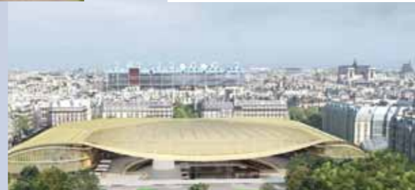
Cité des Cultures Urbaines - Paris (Chatelet les Halles)