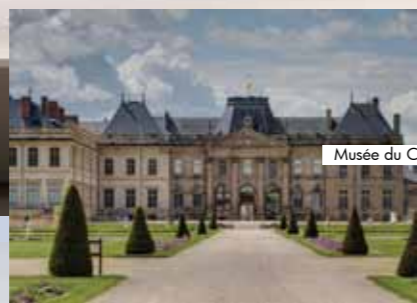
Musée du Château - Lunéville