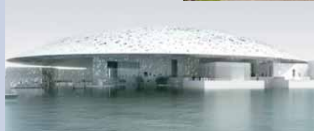
Louvre - Abu Dhabi