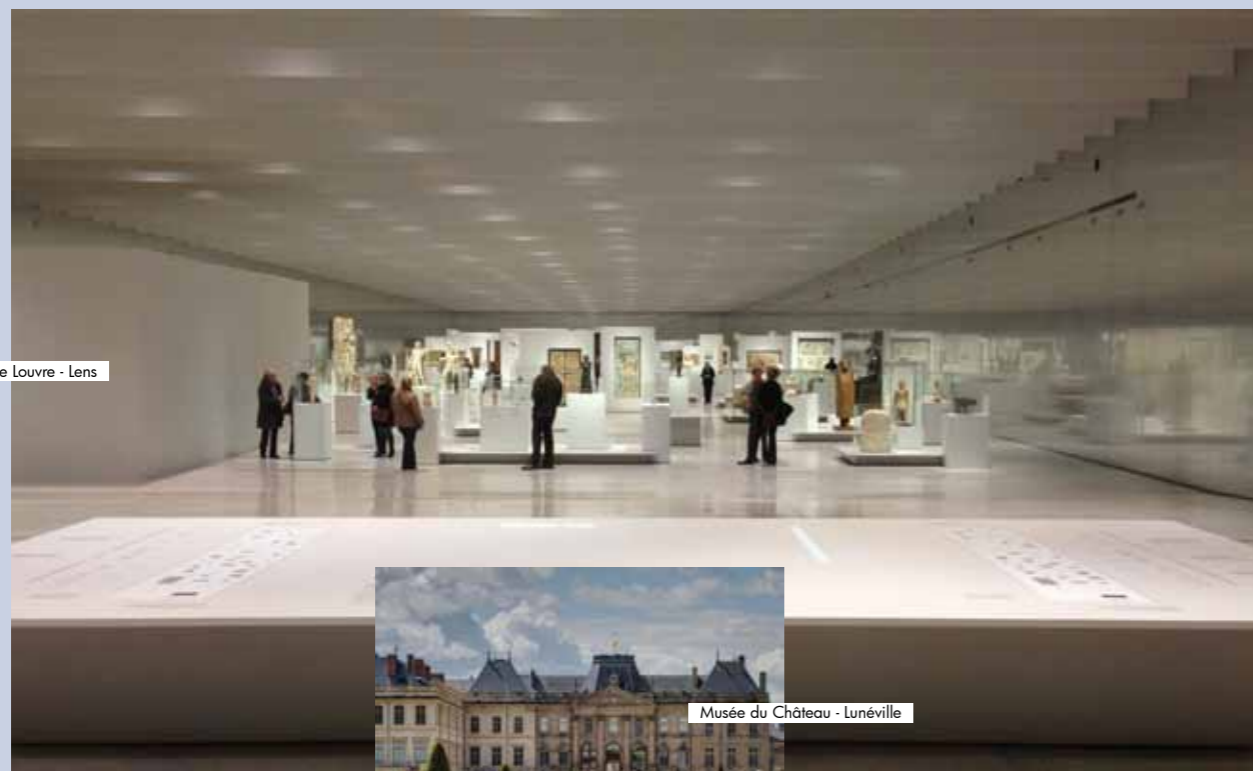
Musée Louvre - Lens